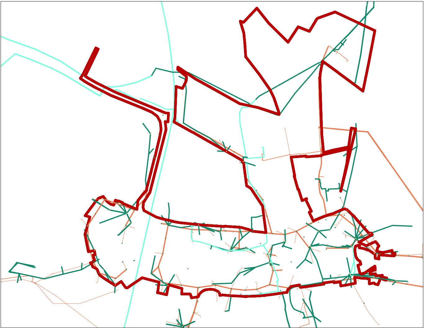
TECHNICKÁ INFRASTRUKTURA - NADZEMNÍ SÍŤ ELEKTRICKÉHO A SDĚLOVACÍHO VEDENÍ m 1 : 5 000